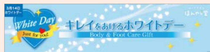
■11春 ボディケア&フットケアシリーズ「WDバージョン」POP 850×200 POP10359