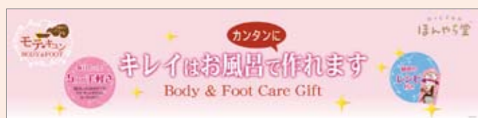
■11春 ボディケア&フットケアシリーズPOP 850×200 POP10356