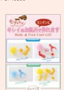
■11春 ボディケア&フットケアシリーズPOP A5 POP10357