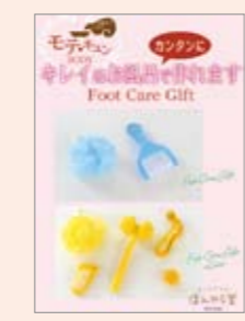
■11春 フットケアPOP A5 POP10357