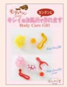
■11春 ボディケアPOP A5 POP10357