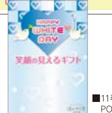
■11春 WDバージョンPOP A5 POP10397