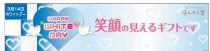
■11春 WDバージョンPOP 850×200 POP10396