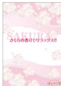
■11早春 さくら全般 POP A5 POP10331