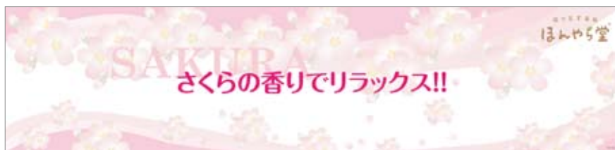
■11早春 さくら全般POP 850×200 POP10330