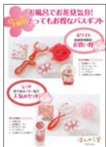
■11早春 さくらバスギフトPOP A5 POP10333