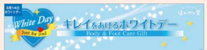
■11春 ボディケア&フットケアシリーズ「WDバージョン」POP 850×200 POP10359