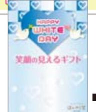
■11春 WDバージョンPOP A5 POP10397