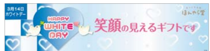
■11春 WDバージョンPOP850×200 POP10396